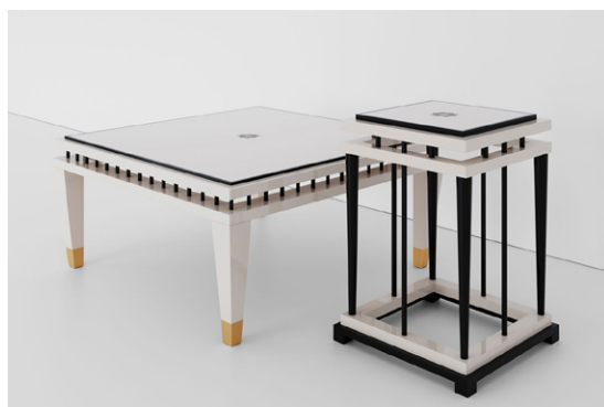
krem / czern