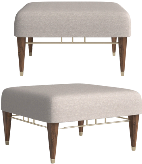
BOB FOSSE POUF